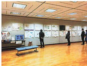
建築科 卒業設計展