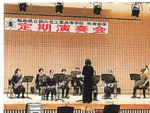
吹奏楽部 第41回定期演奏会