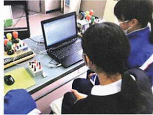
小中学校体験学習応援事業