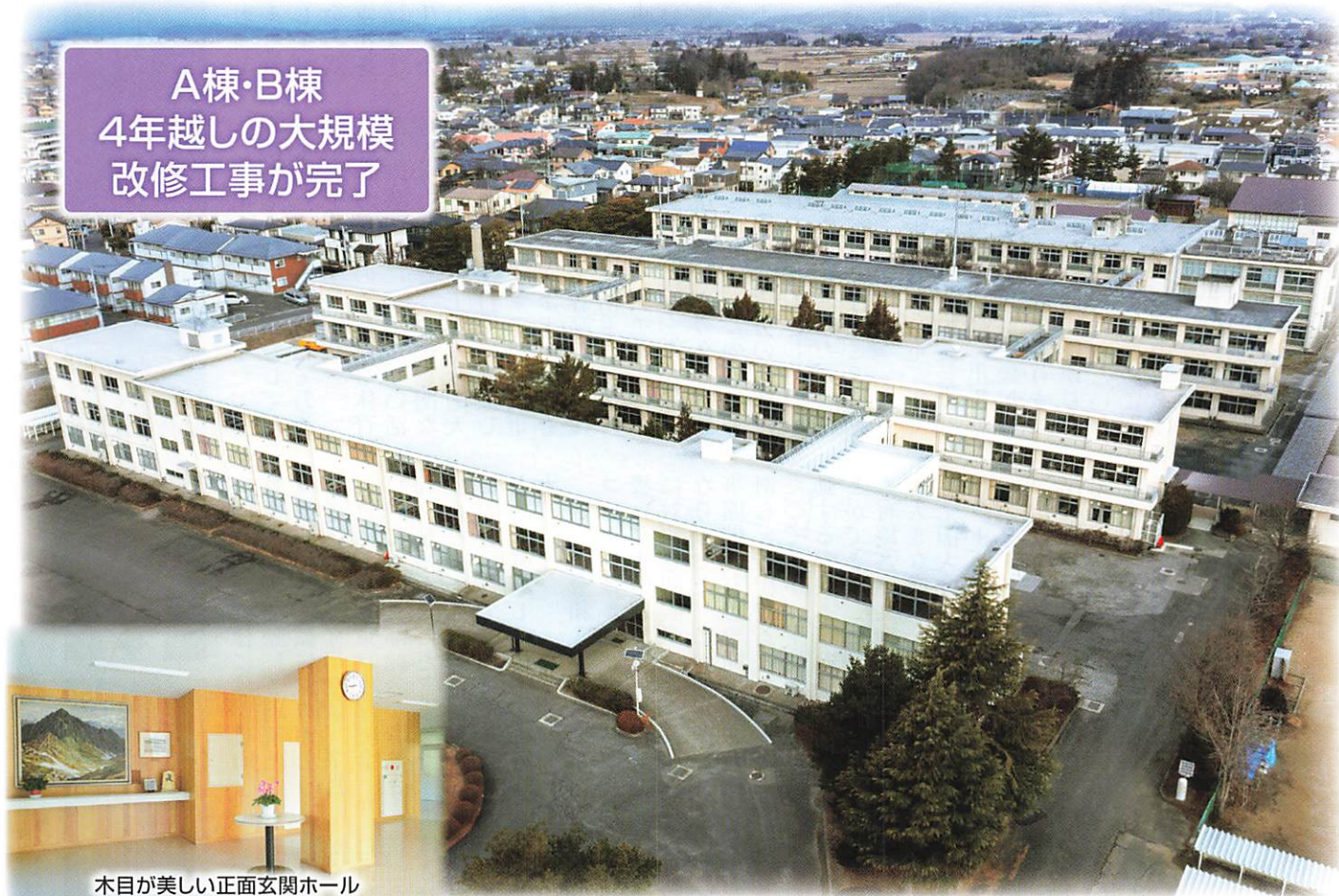
木目が美しい正面玄関ホール