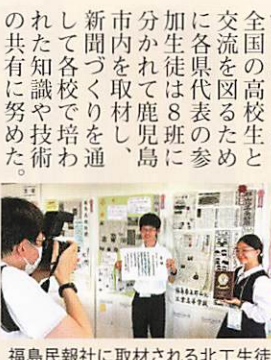
福島民報社に取材される北工生徒

事前提出した新聞を評価され、第47回全国高等学校総合文化祭新聞部門優秀賞、第27回全国高等学校新聞年間紙面審査優秀賞を受賞した。また、全国の高校生と交流を図るために各県代表の参加生徒は8班に分かれて鹿児島市内を取材し、新聞づくりを通して各校で培われた知識や技術の共有に努めた。