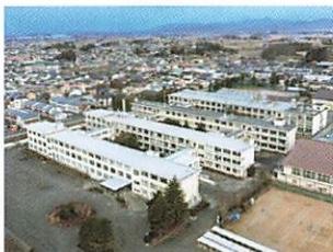
改修後の校舎全景