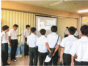
中学生1日体験入学